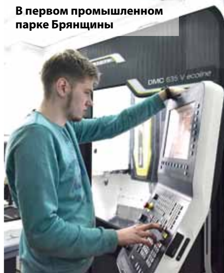
В первом промышленном парке Брянщины

Конечно, при любых кардинальных изменениях необходимо учитывать мнение жителей, но немаловажно вырабатывать у граждан культуру по сохранению окружающей среды. Ведь все мы должны заботиться о том, в каком мире будут жить наши дети, внуки, правнуки!