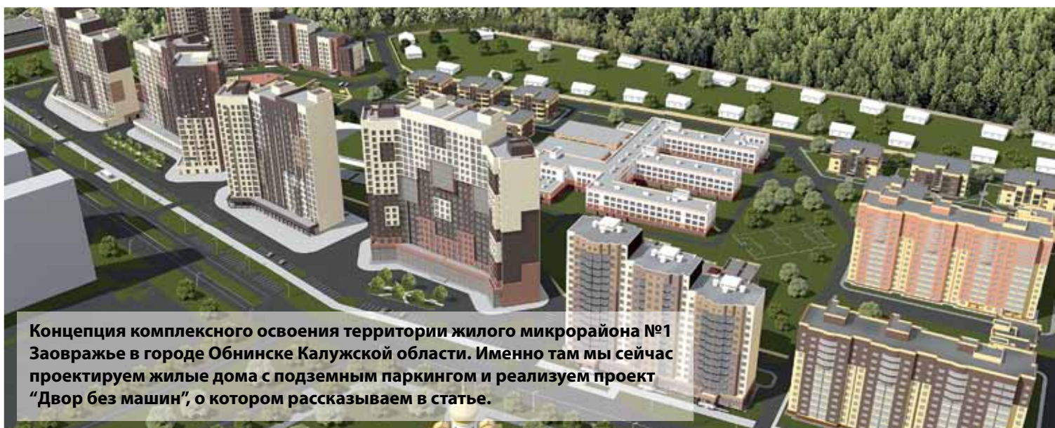
Концепция комплексного освоения территории жилого микрорайона №1 Заовражье в городе Обнинске Калужской области. Именно там мы сейчас проектируем жилые дома с подземным паркингом и реализуем проект "Двор без машин", о котором рассказываем в статье.

If we talk about projects it is more difficult to highlight something most significant. For example, how can we compare a new house construction project with a roof heavy overhaul? Both are important. How to determine what is more significant based on the cost of contracts or the type of work performed? We have designed more than 530 objects for the overhaul of residential buildings, in which people with different incomes live. Acting on their own, they could never put in order the facades and roofs of those houses as well as repair the engineering systems. Is it important or not? I think it is very important. We developed the projects for other socially significant objects, for example, for the construction of a school for 1,000 places in the city of Borovsk, Kaluga Re-