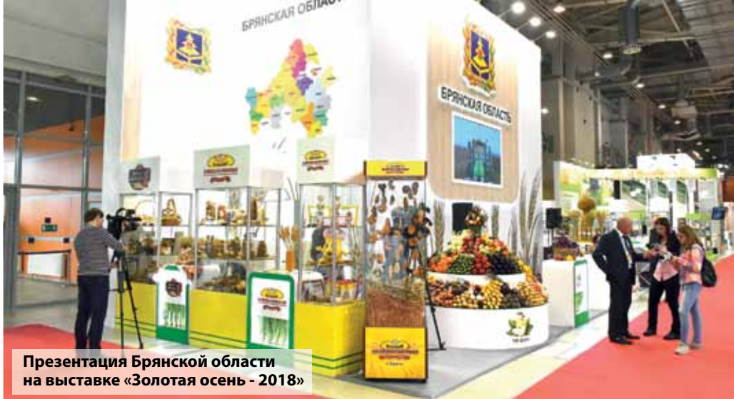
Презентация Брянской области на выставке «Золотая осень - 2018»

Для начинающего экспортера очень важно понять, как работает законодательство других стран, в чем его отличие от законов нашей страны. Поэтому всегда вос-