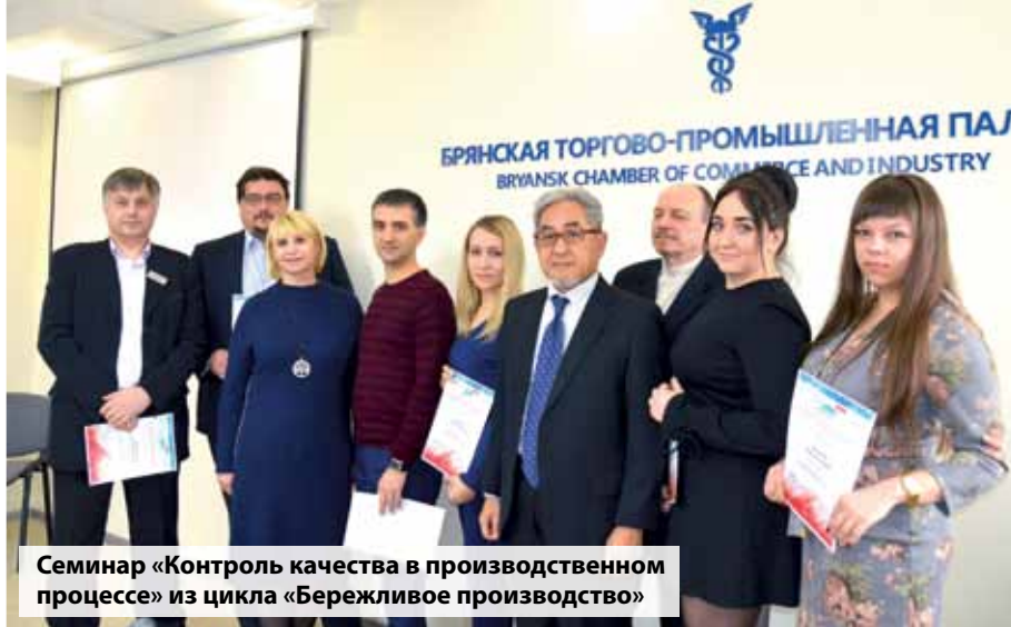
Семинар «Контроль качества в производственном процессе» из цикла «Бережливое производство»

Площадка «Бизнес-маркет» является каталогом предложений деловых услуг и товаров различных категорий с привилегиями для членов торгово-промышленных палат. Для провайдеров B2B-услуг и товаров «Бизнес-маркет» является каналом продаж, фактором подтверждения деловой репутации, а для заказчиков – инстру-